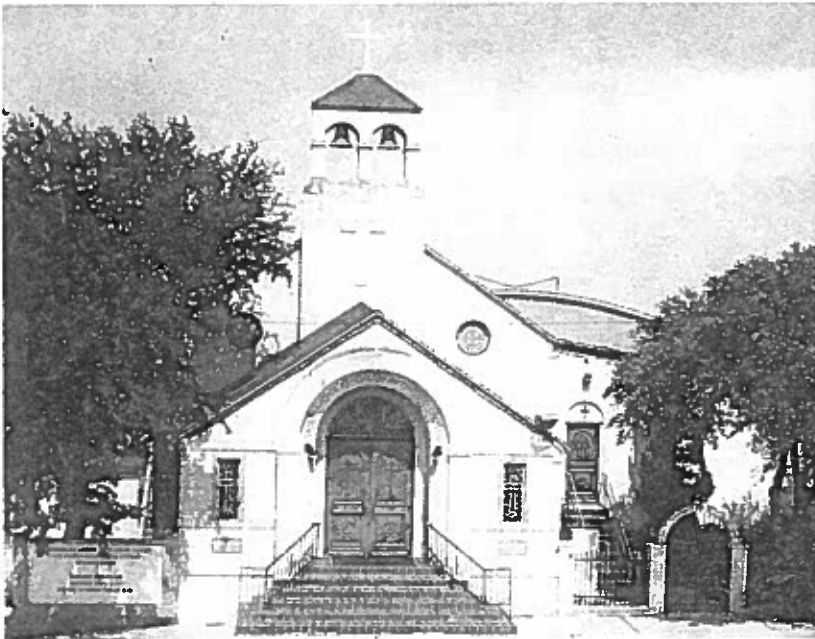
ST. NICHOLAS GREEK ORTHODOX CHURCH CORPUS CHRISTI, TEXAS